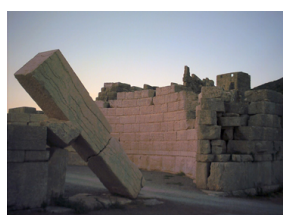
La porte dite d'Arcadie de la ville de Messène, ancienne cité grecque fondée en 370/69 av. J.-C.

à la Maison des Associations du 7 ème VOIR LA DATE DANS LA RUBRIQUE "AGENDA"