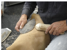
Taille expérimentale d'un biface dans un bloc de silex avec percuteur en bois de cervidé

Qui n'a pas rêvé d'emprunter une machine à voyager dans le temps pour assister aux premiers pas de l'Humanité ?