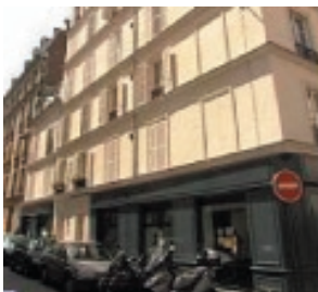
Entrée des bureaux rue Amélie