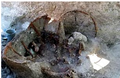
Char d'époque thrace