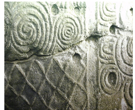
Une ArkéOdysée celtique en Juin

Ainsi, 1/3 de la bibliothèque est d'ores et déjà accessible. N'hésitez pas à emprunter les documents du fonds.