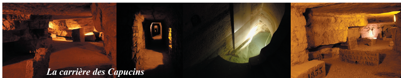
La carrière des Capucins