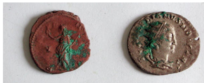
Pièces du règne des derniers empereurs de «l'Empire gaulois» (269 à 274 ap J.-C.)

Après la découverte de ce trésor monétaire par un particulier qui a eu le civisme de signaler sa découverte auprès du conservateur régional de l'archéologie d'Ile-de-france ( Sciences et Avenir du 28/11/08 ) les premières analyses ont commencé. Photos du site et premier rapport sommaire .