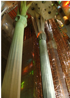
La nef en chantier

il y a plus de 120 ans et dont l'achèvement est prévu dans une trentaine d'années, nous plonge en direct dans les constructions du temps des cathédrales.