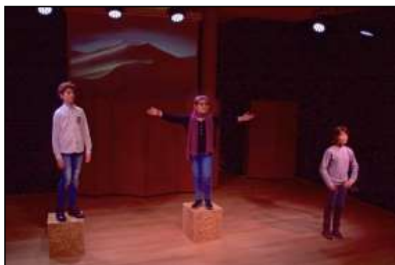
Performance des trois jeunes comédiens