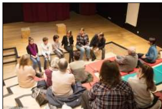
L'équipe répond aux questions de la salle durant la 4 ème édition de la Nuit de la Lecture © Photosphère - Giboudaud P, 2020.