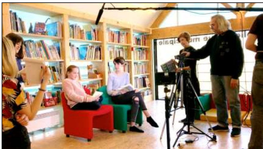
Tournage du ficticiel à la bibliothèque de Rochefort-en-Yvelines © ArkéoTopia - Angibous-Esnault, 2019.