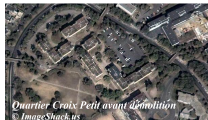
Quartier Croix Petit avant démolition