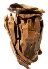
Nucleus remonté

Nous avons retenu le mot nucleus (bloc de silex débité pour produire des lames). Un nucleus remonté avec toutes ses lames étant en notre possession, nous avons commencé à