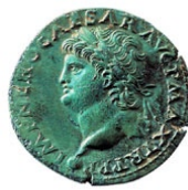
Dupondius (monnaie romaine) représentant Néron © Cabinet des Médailles

sera au catalogue dès le mois d'Avril. Reste maintenant à monter les argumentaires pour la communication et les fils conducteurs pour les animateurs, puis à trouver des commanditaires pour pouvoir réaliser ces sorties. N'hésitez pas à en parler autour de vous pour constituer déjà des demandes.