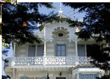
La mode des bains de mer dès 1823