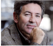
JMBDR © Ph. Matsas

retrouve en Chine et après un séjour au Tibet il rejoint son nouveau poste à Palerme en empruntant le transsibérien. Il écrit des romans et voyage au Pérou au Yémen et en Indonésie.