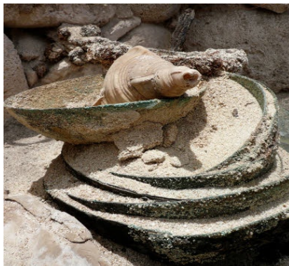
Objets et coupelles en cuivre entassés

Trois nouveaux bâtiments ont été mis au jour et les amorces des murs d'au moins trois autres décelées. Ces découvertes complétées par des sondages périphériques, ont amené les archéologues à réévaluer l'espace occupé par les naufragés, bâtiments et périphérie à environ 1800 m 2 .