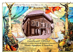
Diplôme remis aux signataires

Le 4 a été remise la pétition pour la sauvegarde du musée-aquarium d'Arcachon et la mise en ligne d'un article expliquant les motivations de cette prise de position. Nous vous invitons à relire cet article en pages 6 et 7.