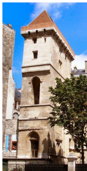
Tour Jean Sans Peur