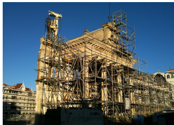
Le centre ville d'Arcachon en pleine restructuration. Ici la façade de l'ancienne mairie en attente d'un bâtiment.

[5] Voir le bulletin d'information du 18 Janvier 2011 de l'association.