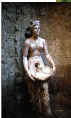
Allianoï Mosaïque et vue des fouilles Bassin de source chaude et statue

À noter la présence tout proche de Pergame et l'apport touristique considérable pour la région de ces deux sites rapprochés.