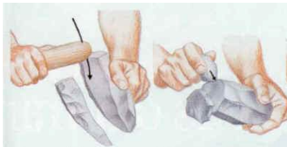
Débitage de lames et préparation du plan de frappe

préparer sa présentation dans une petite vitrine en plexiglass avec un éclaté et un cartel explicatif. Malheureusement, nous avons appris en milieu de mois que l'opération venait d'être annulée par manque de participants, les personnes initialement engagées s'étant rétractées. Nous regrettons que ce projet original et intéressant n'ait pu avoir lieu ainsi que le temps passé et l'investissement de la vitrine.