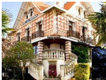
Architecture typique des villas arcachonaises